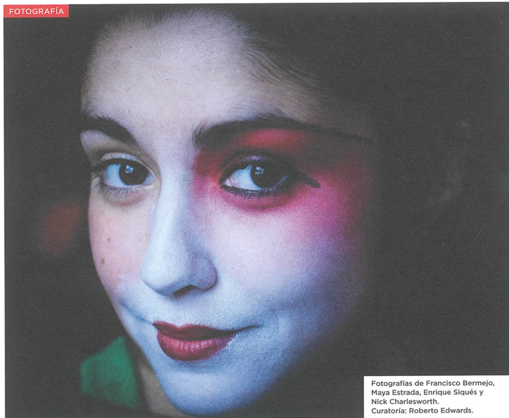
Fotografías de Francisco Bermejo, Maya Estrada, Enrique Siqués y Nick Charlesworth. Curatoría: Roberto Edwards.

(*) Los talleres requieren una inscripción previa en www.festivaldramaturgiaeuropea.cl . Para las funciones se repartirán previamente invitaciones (consultar en Mesón de Informaciones), y a las lecturas se accederá por orden de llegada.